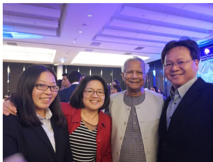
本校參與年會師生與 Dr. Muhammad Yunus 合影